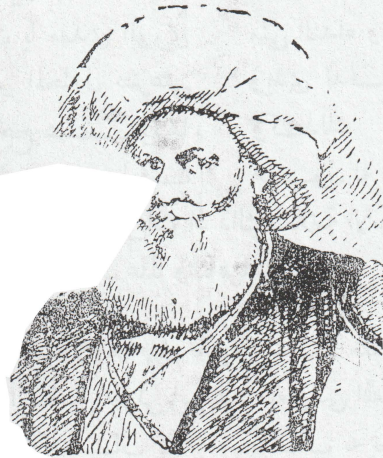
(( محمد على باشا ))

المقصود بالفتح التركي المصرى للسودان هو المدة الواقعة ما بين فتح سنار الى سقوط الخرطوم في يدي الامام السيد محمد أحمد المهدي وهذه المدة من عام ١٢٣٦ هـ الموافق سنة ١٨٢١ م الى سنة ١٣٠٢ هـ الموافق عام ١٨٨٥ م وقد عرف هذا الاسم عند العوام من أهالي السودان باسم « التركية السابقة » . ويحدثنا التاريخ انه لما قام اسماعيل باشا نجل محمد علي باشا من مصر لفتح سنار قام معه ثلاثة من العلماء الأجلاء وهم الأساتذة الشيخ أحمد السلاوى المغربى المالكي والسيد أحمد البقلي الشافعي والشيخ محمد الأسيوطى الحنفى والغرض من ذلك أن يقنع هؤلاء العلماء بالأدلة الشرعية سكان السودان بضرورة التسليم بغير حرب بحجة ان الاسلام يحث على طاعة أمير المؤمنين والخضوع له .